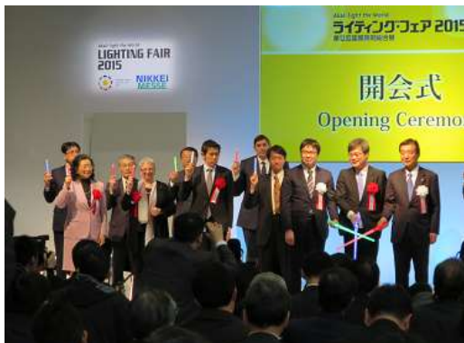
ライティング・フェア2015開会式

3月6日（金）にはライティング・ステージで、加藤技術委員会副委員長による「LED照明信頼性ハンドブック改訂！故障要因まるわかり」の講演を行いほぼ満席の盛況であった。