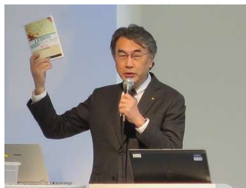
加藤技術委員会副委員長講演風景